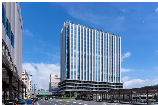
住所: 広島市南区松原町2番62号 広島JPビルディング2F (広島東郵便局跡地)